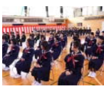
校長先生の話に真剣に 聴き入る新入生